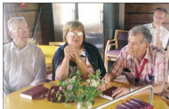
Oman kylän väkeä Karjalaisen kulttuurin kurssilla