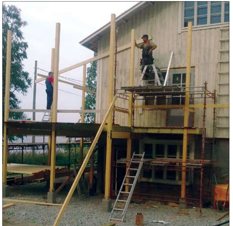
Terassi alkaa hahmottua 30.7.2010

Kiitos kaikille hanketta eri tavoin edistäneille niin rahalahjoitusten lähettäjiä kuin upealle talkooporukallekin!