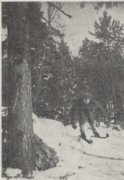
Kohtavaaralta alas... vauhtia, jännitystä.

5. Ellei kotipaikkakunnallamme toimi lähetysompeluseuraa, niin koetamme perustaa sellaisen tai mieluummin ulkolähetys-työseuran. Missä suhteessa sitten työseura tulisi eroamaan ompeluseurasta? Siinä suhteessa, että koetetaan saada miehiä mukaan ja että mikäli mahdollista siirrytään salista pirtin puolelle. Työseurassa ei ole tarkoitus vain kokoontua lähetysasian hyväksi ja ehkä kantaa kolehti, vaan sanan mukaisesti uurastaa tämän asian hyväksi. Miehillä koetetaan järjestää puhdetöitä. Puusta tehdyt työkalut ja talousesineet sopivat mainiosti lähetysmyyjäisiin, joita toimintakauden päätyttyä järjestetään. Naiset tietysti tekevät näissä työseuroissa käsi- ja punontatöitä. Miesten ja naisten töitä järjestettäessä on otettava huomioon se, ettei tule puutetta raaka-aineesta. Punontatöitä voidaan ajatella tehtävän esim. paperinuorasta jne. Työseuraan voidaan sitten järjestää puheita, esitelmiä, lausuntaa jne. aivan kuin ompeluseuroihinkin. Onko joukossamme ketään, joka uskaltaa lähteä kokeilemaan työseuran toimintamahdollisuuksia eikä säiky mahdollisia vaikeuksia? Ensimmäinen työseura on vielä perustamatta — kuka perustaa sen?