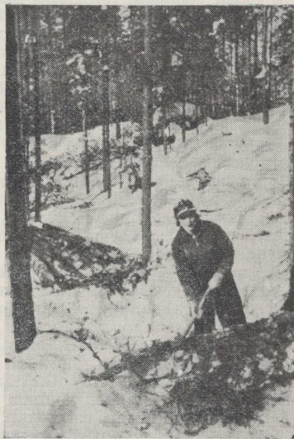
Muistattehan, kun oltiin rankometsässä ... ?

Päättäjäisten yhteydessä olivat opistoajan näkyvät tulokset myöskin kaikkien tarkasteltavina. Käsityönäyttely oli suurin, mitä opistollamme on vielä tähän men-