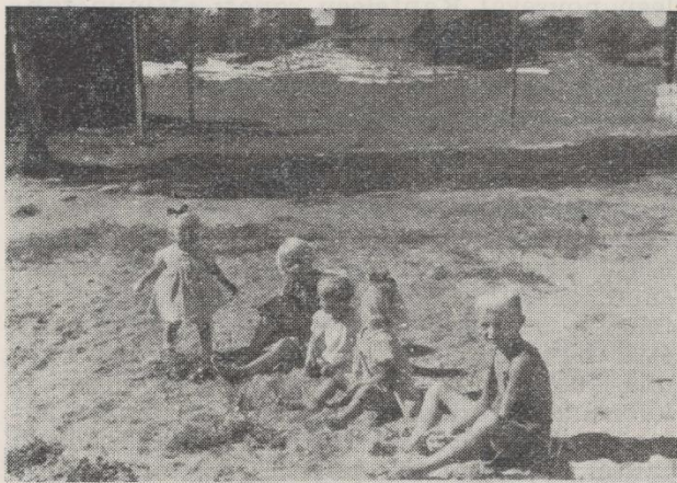
„Hän lähti pois — ja meitä odottaa...“

Ruumiillisesti kehityit hyvin, reippaaksi miehenaluksi, henkisesti normaalia nopeammin ja älykkäämmäksi, kuten opettajasi useasti jo eläessäsi sanoi. Vallaton sinä olit, pojan vekkuli, mutta aina valmis sopimaan ja anteeksi pyytämään, ja rehellinen!