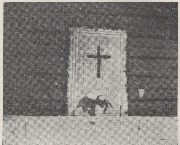
Pirttimme kätkee pyhiä muistoja.