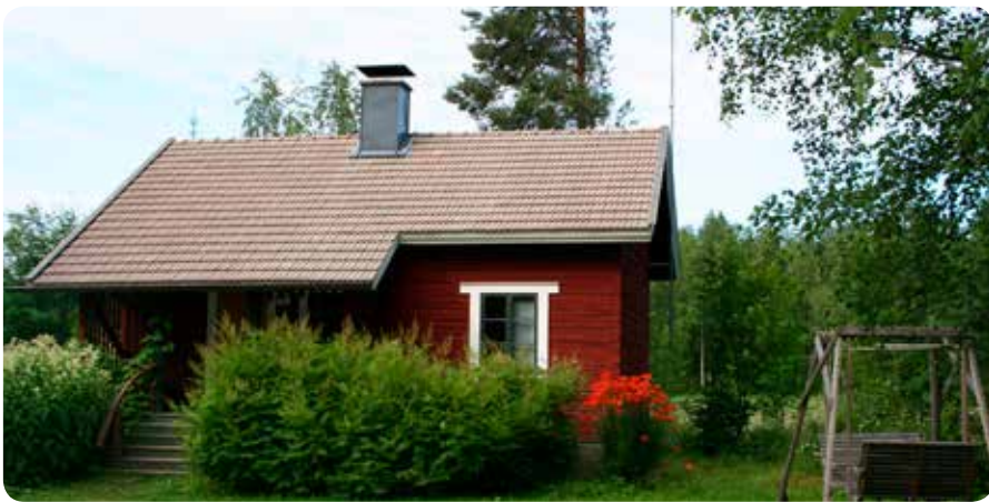
Paavolan Lomien Kiehko.

Metsän reunustamien peltojen keskellä ja lähellä järveä on vanha hirsimökki. Perheemme on viettänyt siellä monta kesälomaa. Mökissä on tupakeittiö, kaksi pientä kamaria, eteinen ja veran-