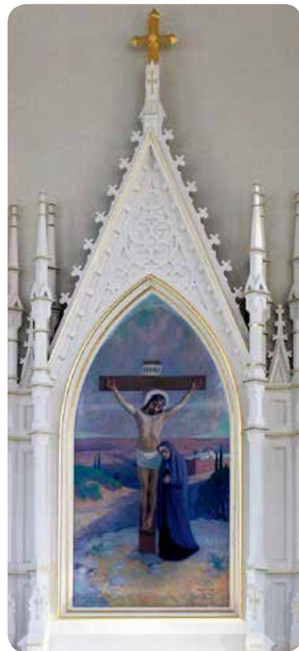
Ristiinnaulitsemisen surua. Nurmeksen kirkon alttaritaulu kuvaa Mariaa poikansa ristin juurella. Taulun on maalannut Väinö Hämäläinen vuonna 1913.

Naisten yhteys syntyi lasten kautta. Sukulaisia he olivat ennestään, nyt ystäviä aivan erityisellä tavalla. Jumala oli ilmoittanut heille kummallekin suuria ja he itse tiesivät enemmän kuin muut. Äitiytensä koko tuskaa he eivät kuiten-