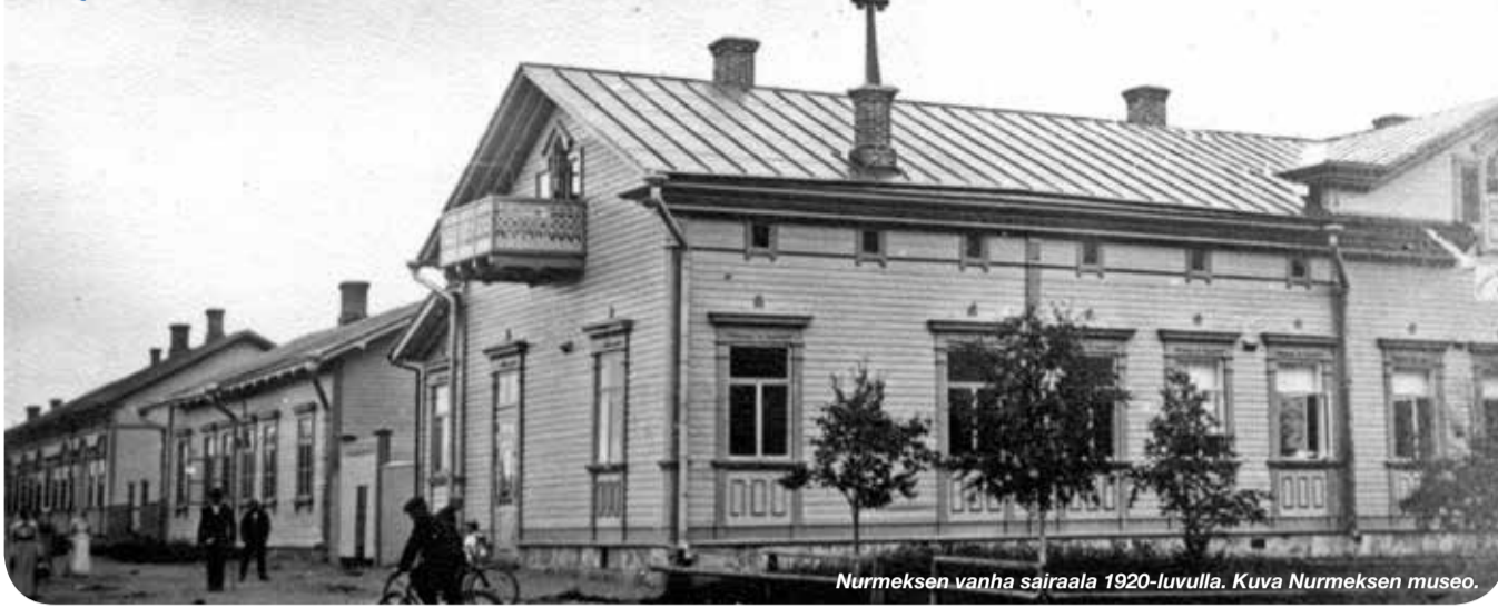
Nurmeksen vanha sairaala 1920-luvulla.