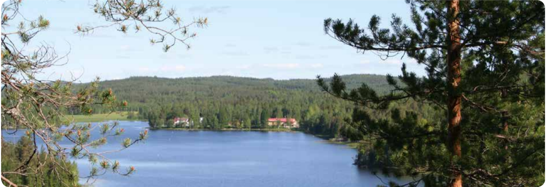
Kuva Riuttavaaralta Haikolan suuntaan Sinikka Mustonen.