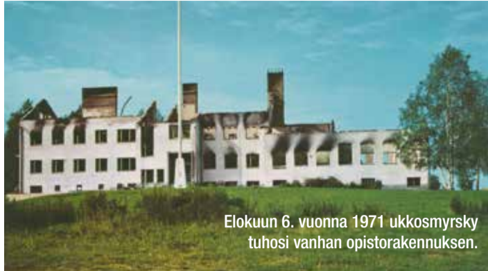
Elokuun 6. vuonna 1971 ukkosmyrsky tuhosi vanhan opistorakennuksen.

Nuorisotyössä meille oli tärkeintä auttaa jokaista nuorta löytämään oma persoonansa, olemaan oma itsensä. Tässä mielessä kansanopistovuosi Kohtavaaras-