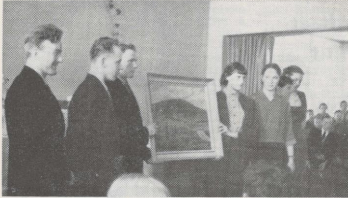
Kiertopalkinnon toistamiseen voittanut Karstulan joukkue.