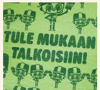
Haikolassa pesurätitkin soittaa samaa säveltä...