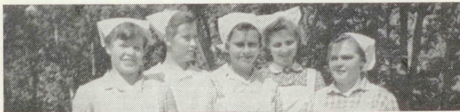
Aitien lomaleirillä auttamassa olleita tyttöjä. Leiri pidettiin 8—14. 6. ja äitejä oli kaikkiaan 52, eniten Enosta, 20. Heidän olonsa leirillä kustansi seurakunnat ja hiippakunta.

Olen näkevinäni, niin kuin Herra kulkisi meidän keskellämme. Hän katselisi sisään kokoushuoneisiin, joissa päätetään, joissa organisatiot, järjestöt päättävät asioistaan. Ja Hänen täytyy vetäytyä pois. Minä olen näkevinäni, kuinka Hän tulee ja katselee niitä pieniä poikia ja tyttöjä, jotka kohta valmistuvat oppi-koulujen sisäänpääsytkintoihin. Ja Hän varmaan niitten lasten kohdalla pysähtyy, jotka epäonnistuvat. Ja Hän sanoo: "Kaiken, minkä olette tehneet yhdelle minun vähimmäistä veljistäni, sen te olette tehneet minulle." Jumala antakoon meille armon, että näkisimme tämän Herran Suomen kansan keskellä. Ja Jumala antakoon teille, nuoret rakkaat ystävät, joilla on kirkaamat silmät kuin meillä vanhemmilla, joiden silmät synty on sumentanut niin monta kertaa, antakoon teille palavan katseen, niin että te uskaltaisitte lähteä tämän Herran perässä. Sen Herran perässä, joka lähtee kokouksista pois, koska siellä ei ole Hänelä tilaa. Ja jonka seurassa opitaan kantamaan vastuuta. Ja sen Herran perässä, joka pysähtyy yhden epäonnistuneen kohdalle. Sellaisen kohdalle, joka ei saa pisteitä. Löytäisitte elämäntehtävänne siinä, että voisitte auttaa näitä nuoria ihmisiä, lapsia ja vanhempiaakin ihmisiä, joita kukaan ei auta, koska heitä ei pidetä minkään arvoisena.