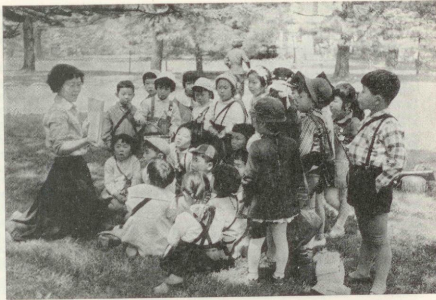
Retkellä kasvitieteellisessä puutarhassa. Opettaja näyttää "kanishibai'ta". (Kani = paperi, shibai = näytelmä, eräänlainen kuvakirja.)