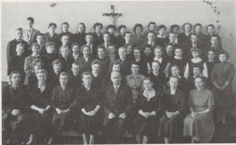
Viime kurssin oppilaat opettajineen.