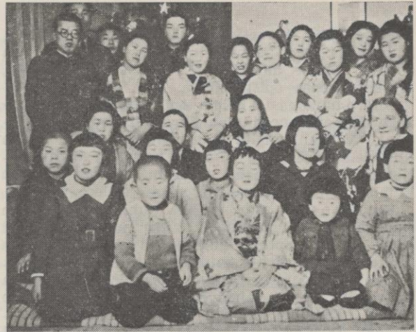
Uudenvuoden illanvietto past. Savolaisen kodissa Japanissa.

Päivittäin lähenimme Suomea. Yö kävi valkeaksi synnyttäen rinnassa niin lämpimät tunteet. Olimmehan tottuneet sysisynkkään yöhön kesälläkin, vaikkapa päivä olikin parisen tuntia pitempi kuin talvella. Ja vihdoinkin olimme Suomessa, jota emme enää olleet uskoneet näkevämme. Jumalan armo on suuri. — Mutta huolimatta siitä, että nyt on päässyt kotimaahan, on ajatus usein tuolla lähetyskentällä. Kuinkahan ne Asahigawan kristityt jaksavat? Vieläkö he pitävät kiinni uskostansa? Koskahan taas voidaan työ alkaa? Ja niin edelleen loppumattomiin. Toistaiseksi voimme vain sydämessämme huokailla heidän puolestaan. Mutta ehkä piankin taas sota pakanuutta vastaan alkaa, junat ja laivat vievät lähetystyöntekijöitä tuohon kaukaiseen