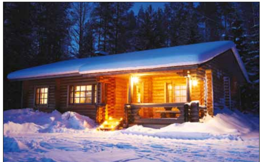
”Rakentaminen on minulla verissä: parhaina vuosina valmistui kaksikin mökkiä.”

järven rannalla, ei tavoita ohikulkevaa matkailijaa, koska Haikola ei ole minkään päätien varrella. Toiseksi pitäisi olla ympärivuotisia majoitustiloja, jotta saataisiin pitempiäaikaisia kävijöitä. Pitotalotoimintaa vaikeuttaa myös se, että paikkakunnalla on jo pitkään toimineita majoitus- ja ruokapalvelujen tarjoajia. Niinpä Haikolan tunnetuksi tekemisessä on vielä paljon haasteita.