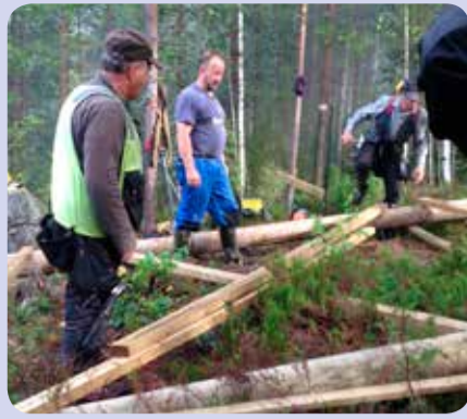
8.8. klo 8.15 Ristikon kasaamista.