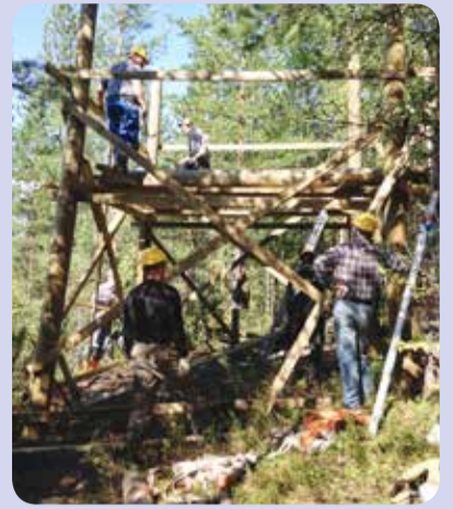
8.8. klo 12.47 Kehikko syntyy.