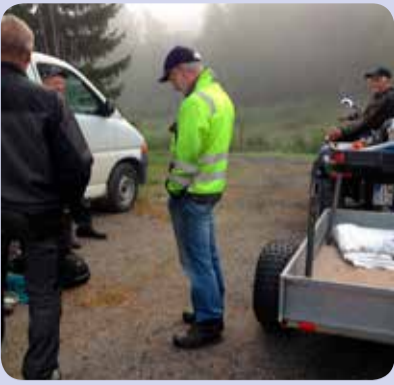
8.8. klo 7.01 Kokoontuminen.