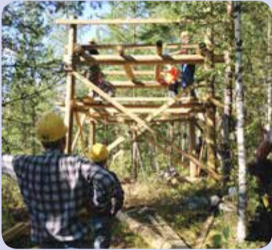
8.8. klo 15.15 Torni jo hahmollaan.