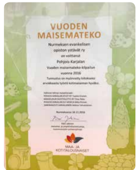
Vuoden maisemateko Pohjois-Karjalassa 2016 -kunniakirja.

Maa- ja kotitalousnaiset nimesivät Koh-tavaaran luontopolun ja Toivontornin Vuoden 2016 maisemateoksi Pohjois-Karjalassa. Se jatkaa valtakunnalliseen loppukilpailuun.