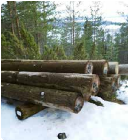
Pylväät vaaralla 3.4.2016.