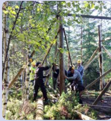
8.8. klo 9.29 Pylväät pystyyn!