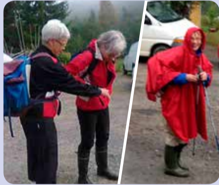
Välrikahvit lähdössä vaaralle. Satoi tai paistoi!