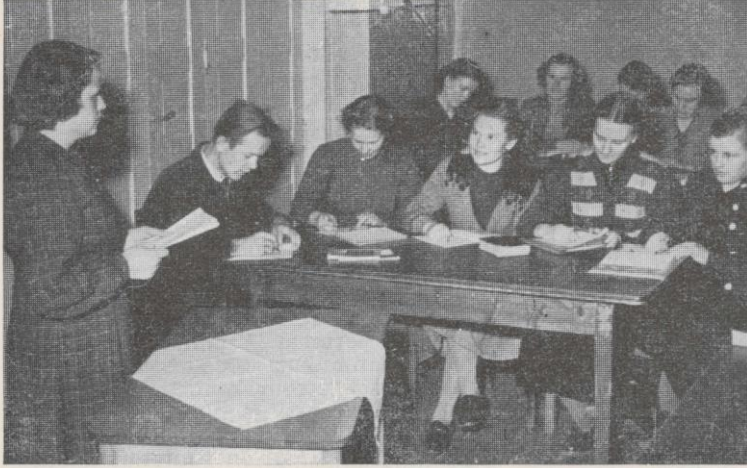
Opintopiirissä pidetään juuri esitelmää.

tävät Saksaan asti syömään, koska täältä ruoka loppuu, eikä paasto käy laatuun viikkomäärin. Sensijaan poikaset nukkuvat horroksessa odotusajan lan-nistumatta lainkaan vanhempien pit-kästä poissaolosta. Saimme "IHMEELLE" uutta sisältöä: luomakunta on sitä täyn-nä. Ja sittenkin yhdyimme luennoitsijan tunnustukseen: Suurin ihme on se, että syntinen ihminen on Jumalan lapsi!