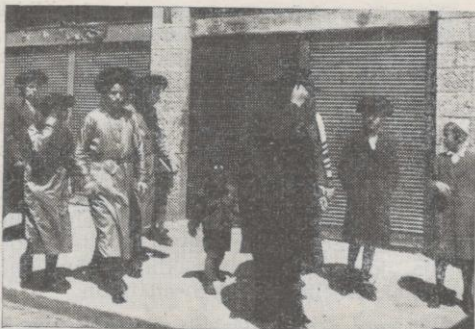
Oikeauskoiset tulossa synagoogastaan.

mista he eivät salli, koska Mooses on sanonut »Älä tee kuvaa!» Oheisen kuvan, jossa eräs peittää juuri kasvonsa, ehti eräs joukostamme tietämättömydessään näpätä, saaden kuitenkin muutamia huutavia nuorukaisia kimppuunsa. Tässä kaupunginosassa on vaarallista sapattina ajaa autolla, voi joutua kivisateen kohteeksi. Ja kaikenlaisia mellakoita on siellä kuulemma vähän väliä. Kristinuskoon kääntyneitä juutalaisia pitävät nämä kiihkeät ortodoksit kansansa vihollisina.