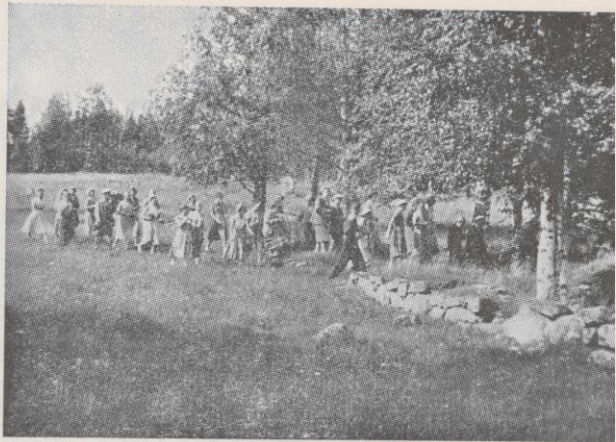
EYL:läiset Kohtavaaralla vanhan Haikolan paikkaa tutkimassa