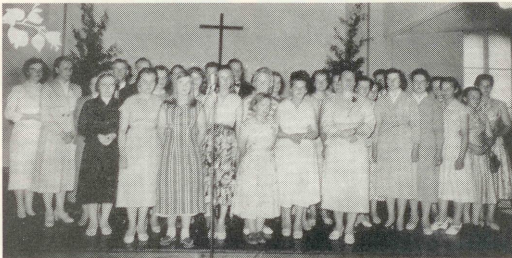
Mekin "lapset Kainuun Karjalan" toimme terveisemme.