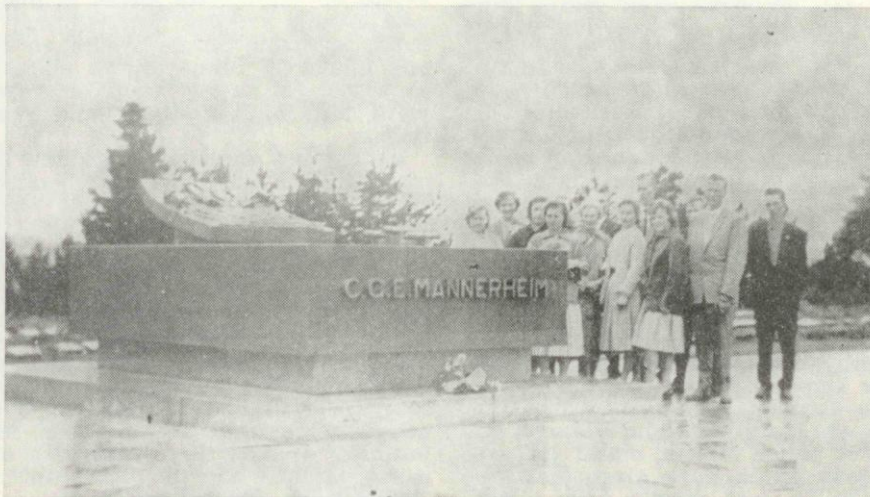
Retkeläiset marsalkan haudalla Hietaniemen hautausmaalla.