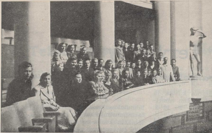
Viime talven opistolaiset pistäytyivät opintomat- kallaan eduskuntataloon tutustumassa.

rattu myös tilaisuus eräiden keskikoulu- aineiden ja soiton opiskeluun.