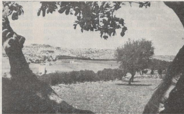
Paimenten keto. — Taustalla Betlehemin kaupunki