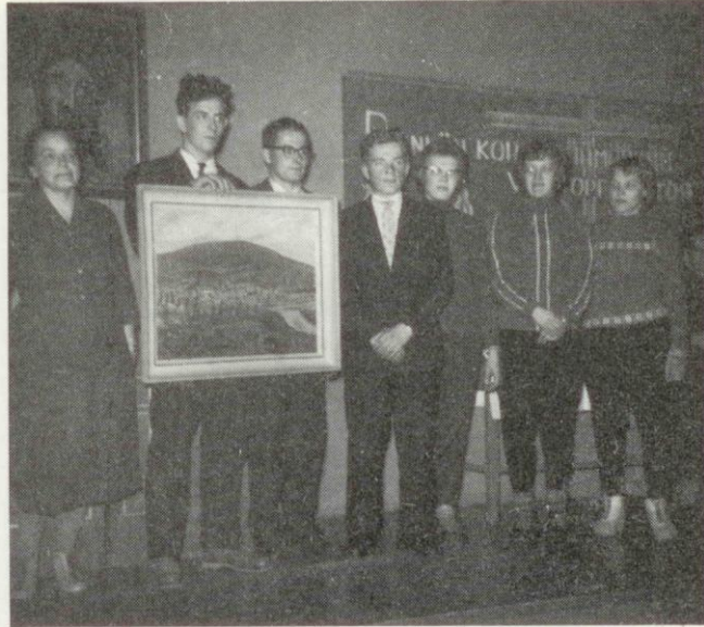
Kaustisen voitollinen joukkue.