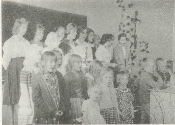
Opistolaisia ja pyhäkoululaisia yhteisen kevätjuhlan ohjelmaa harjoittelemassa

Eikö kesän kauneus täytä sydämen pakahduttavalla ilolla ja samalla viittaa johonkin suurempaan onneen. Sitä ei niinkuin kykenisi vastaanottamaan sillä tavoin kuin tuntee tarvetta, kuin kaikesta huolimatta täytyisi jäädä toteamaan erään runon tavoin sydämestään: