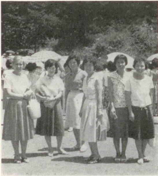
Lastentarhamme opettajat Zaōn kokouksesta 25. 7. 1962.