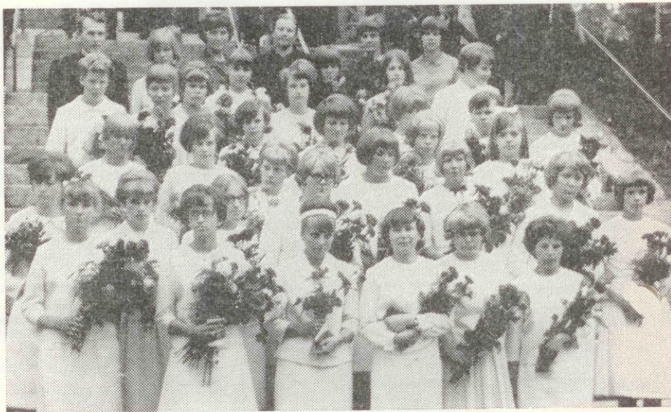
Rippikoulujoukkomme Nurmeksen kirkon portailla suurena juhlapäivänä.