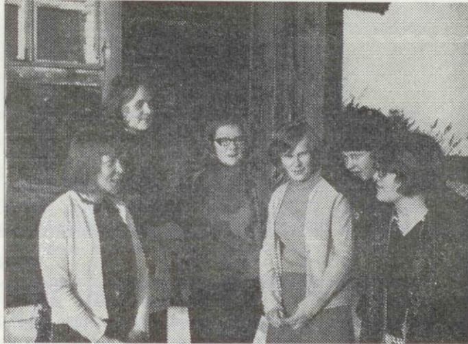
Opistolaisia palveluretkellä pysähtyneinä hetkeksi yhteiseen kuvaan, Illoiset katseet kertovat Jumalan lapsen ilosta