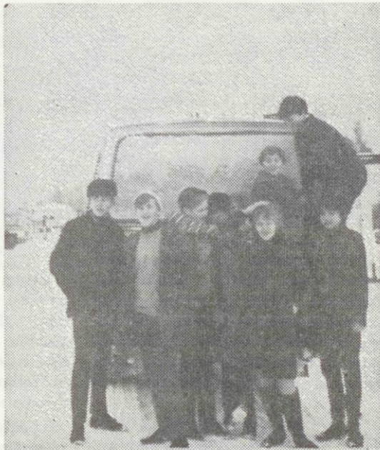
Opistomme uljasta hiihtojoukkuetta evangelisten opistojen talvipäivillä Karkussa 24—26. 2. 1968