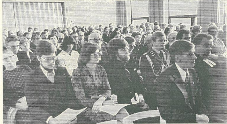
Tupaantuliaisissa oli juhlaväkeä salin täydeltä.

Näin kuitenkin voi tapah- tua vain, jos ei unohdeta, ettei ihmisen arvo riipu siitä, mitkä ovat hänen mahdolli- suutensa ja rajoituksensa. Täl- mä arvo hänellä on aina si- nänään. Mutta sen mukaista ja oikeastaan siitä johtuva teh-