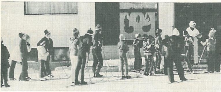
Kuntokurssin yksi jännittävimmistä tapahtumista oli lasten hiihtokilpailu, kuvassa menossa ilmoittautuminen kilpailuihin.