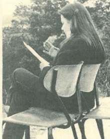
Paikka Annen vieressä on vapaa. Istahda sinäkin nauttimaan Pohjois-Karjalan rauhaisasta ympäristöstä. Kiipeä illansuussa Kohtavaaralle ihaillemaan Suomen suvea ja mahtavia maisemia. Se kannattaa.