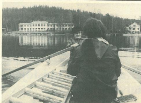
Pieni soutu retki Lipinlahdella Kielon ja Kyllikin tapaan irrottaa sinutkin arjesta. Mitäpä olisi pitempi risteily Pielisellä?!