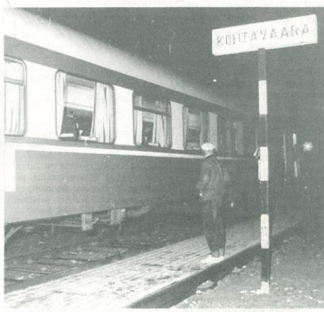
Tämä näky ikustettiin tiistai-iltana 22.10.1985. Kesäkuun 1986 alusta makuuvaunut kulkevat säännöllisesti aamuin illoin Kohtavaaran kautta.