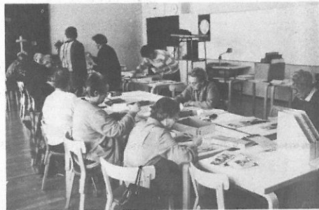
Kurssilaiset järjestävät opiston historian dokumentteja.