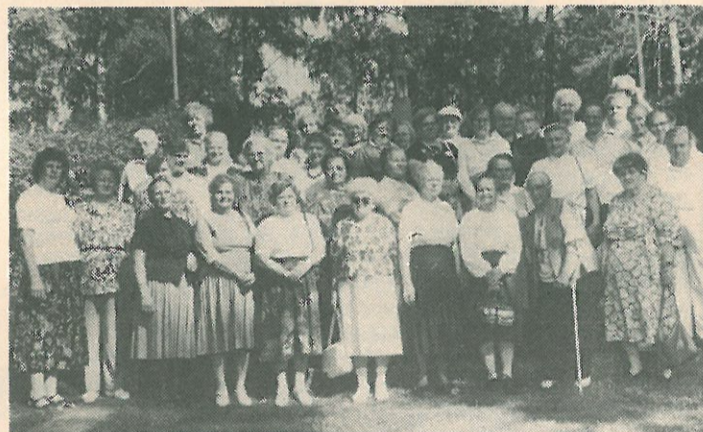
Sotainvalidien veljesliitto on tänä vuonna juhlinut 50-vuotista toimintaansa. Opistolla on jo kuuden vuoden ajan järjestetty sotainvalidien puolisoitten virkistyskursseja. Kuluneena kesän sää suosi kursseja, kuten aiemminkin. Kurssilaiset kävivät laskemassa seppeleen sodissamme kaatuneitten haudoille. Kurssikuva otettiin sankarihautausmaan portailta.