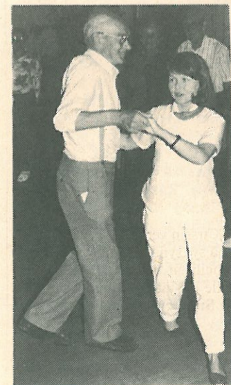
Karelen fjärran men ändä nära-kurssilla opiskeltiin karjalaniirakoitten leipomisen ohella karjalaisia leikkejä.

Minun mielestäni kyllä voi, vaikka kesä alkaa olla tuulen tanssittamia, keltaisia ja kuivuneita lehtiä, joissa kulkiessasi kahlait. Mutta muistot kesästä ovat olemassa — ehkäpä juuri ruskan ja syksyn kultraamina. Ja minun muistoni ovat hyviä muistoja. Siksi haluan niistä jotain kertoa.