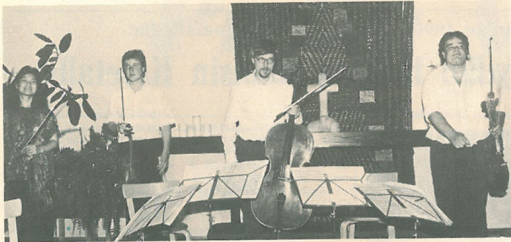
Jean Sibelius -kvartetti konsertoi opistolla täydelle salille.