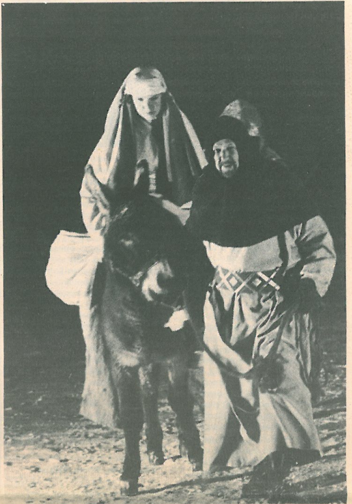
Joosef ja Maria matkalla kohti Betlehemiä. "On tulossa Kristuksen syntymän yö".

Rahoituksesta käydään neuvotteluja jatkuvasti. Niiden päämääränä on löytää sellaisia tukijoita, jotka voisivat taata esityksen jatkon esimerkiksi noin 40–50 % rahoitusosuudella. Loppu voitaisiin kerätä erilaisilla tempauksilla, kampanjoilla ja satunnaisilla avustuksilla. Näihin jälkimmäisiin luetaan myös Immanuel -joulukortin myynti jatkossakin. Viime vuonna sitä