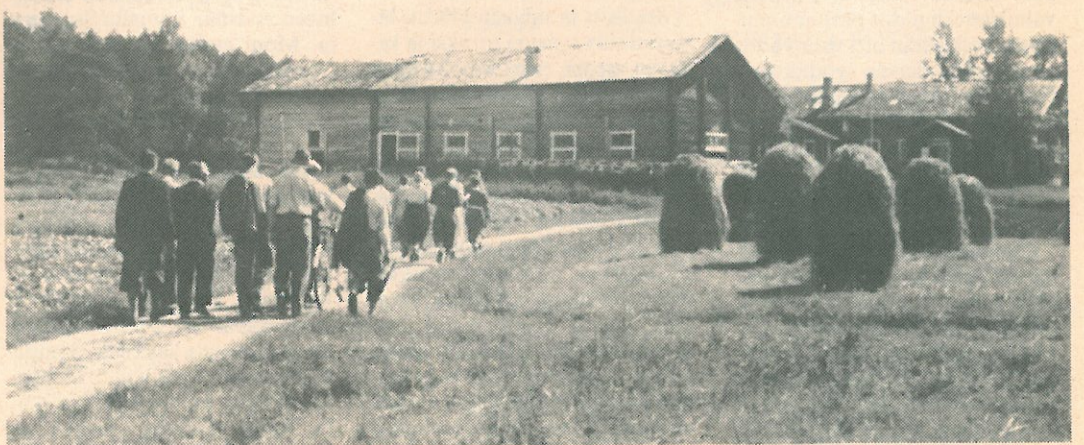
Opistomme on toiminut Lipinlahden kylässä jo lähes puoli vuosisataa. Ensi vuoden alussa 7.—12. tammiukuuta vietetään 50-vuotisjuhla. Kuvassa saksalaisturisteja saapumassa Haikolan pirttiin.