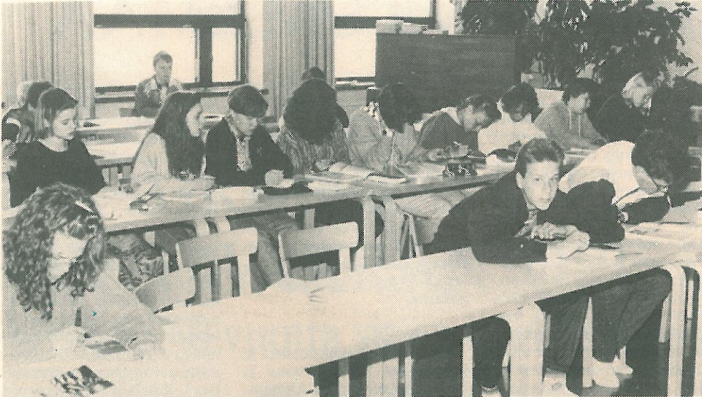
Samanaikaisesti ympäristösuojelukurssin kanssa lähes 50 Malmin seurakunnan nuorta piti rippikoulua opistossamme.