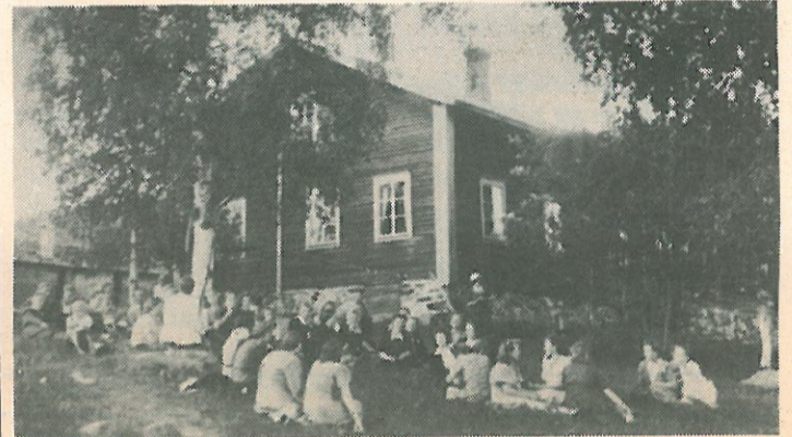
Opiston ensimmäinen kurssi aloitti työskentelynsä Haikolan pirtissä tam- mikuussa 1942.