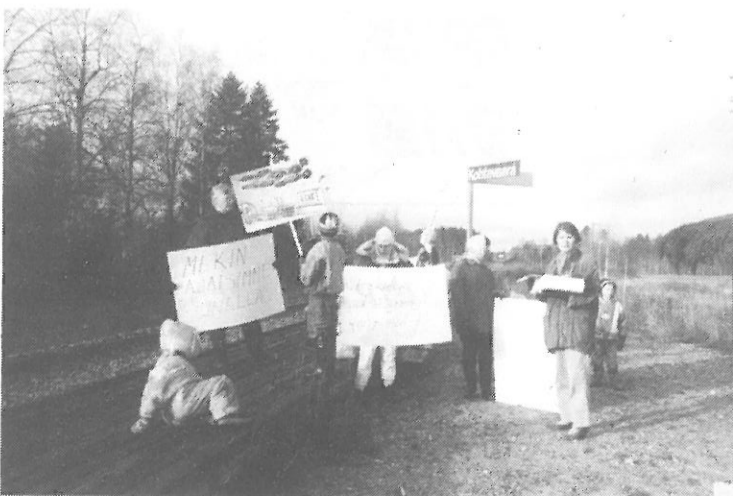
Mielenosoittajia kyltteineen, teksteinä mm. "Mekin ajaisimme junalla" ja "Vi skulle också gärna fara med tåg".