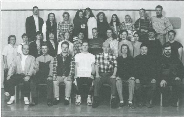
Opiston väkeä syksyllä 1995