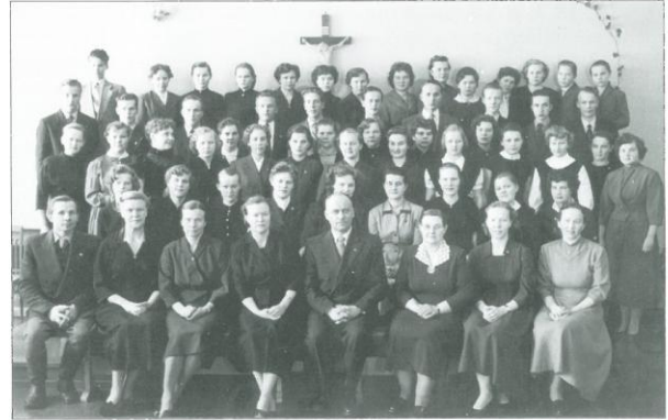
Opiston vuosikurssilaiset 1956-1957. Tunnistatko itsesi? Mitä ajatuksia kuva tuo mieleesi? Kirjoita kuulumisiasi Pirtin Viestin toimitukseen! Kirjoituksia julkaistaan mahdollisuuksien mukaan seuraavissa Pirtin Viesteissä. Olisi hauskaa saada postia myös muilta entisiltä opiskelijoiltamme.