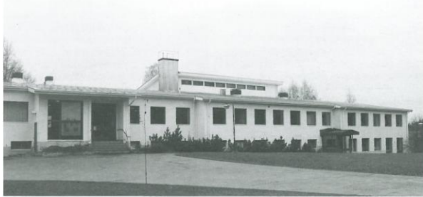
Opiston päärakennus valmistui vuonna 1973.

tunnustuksen pohjalta evankelisen herätysliikkeen hengessä annettavaa opetus-, kasvatus- ja sosiaalista toimintaa. Yhdistyksen voi liittyä kuka tahansa, ja nyt siinä on lähes 350 jäsentä.