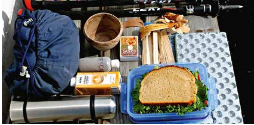
Kuvassa kävelyretken ylellisyyesineitä: taukotakki, kahvivehkeet, voileipä (Pägenin Talon Poikaa, maapähkinävoita, suippopaprikaa ja jääsalaattia), istuinlusta, lohtutulitarpeet ja kävelysauvat.

R.L.Stevenson – kyllä, juuri hän kirjoitti Aarresaaren – on sitä mieltä, että kävelyretki pitää tehdä yksin, koska sen henki on vapaus. Kahdestaan tehtynä, isommasta porukasta puhumattakaan, se on jotain muuta, lähinnä seurustelua, kompromissien tekoa, piknikkiä. Tiedotusvälineet, liedit ja iskelmämusiikki usuttavat meidät uskomaan, että yksinäisyys on puutostila, joka pitää korjata. Päinvastoin! Yksinäisyys on vapautta, kaksinkertaista vapautta. Ensiksi yksilön