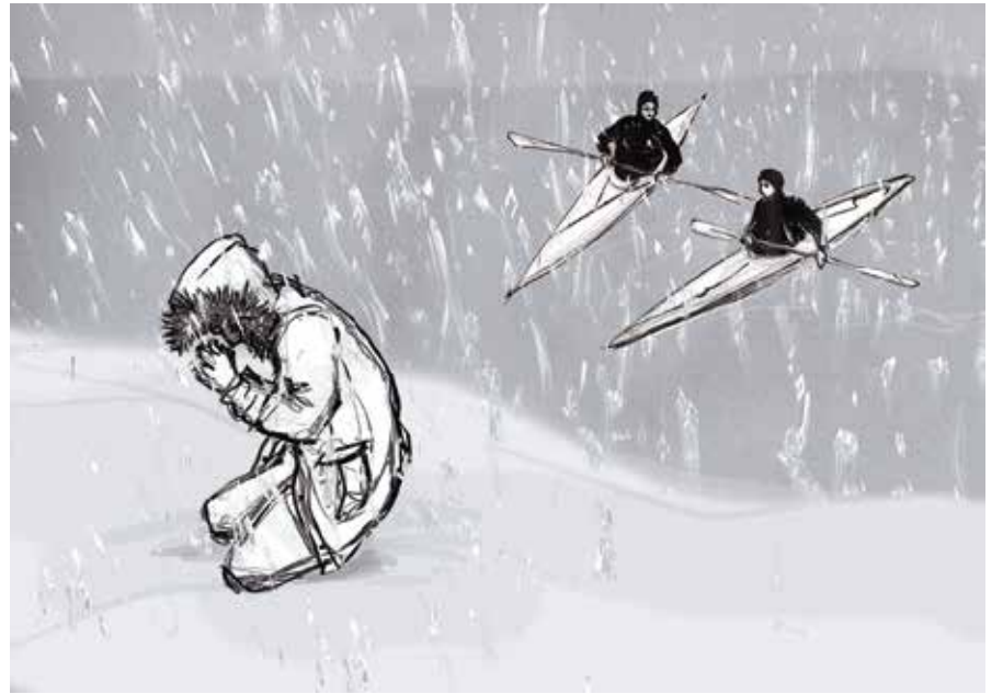
Kuvitus Anna Lampinen.

Tässä vaiheessa se uskonnollinen mies katsoo toista miestä kummissaan: "No, nythän sinä ilmeisesti sitten uskot", hän sanoo. "Sinähän olet hengissä." Ateisti katsoo uskontomiestä kuin tämä olisi täysi ääliö ja sanoo: "No, ei, kun kävi niin, että siihen sattui tulemaan pari eskimoa ja he näyttivät minulle, missä se leiri on." Tarinassa on ulottuvuuksia, ja se kyllä nauratti.